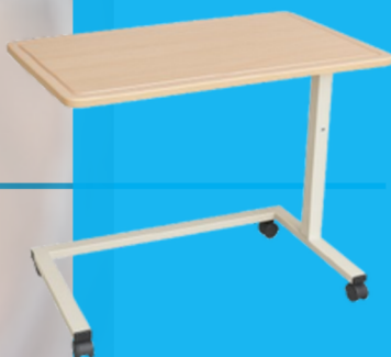
Table de lit Base en "C"