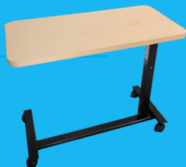
Table de lit Base en "H"