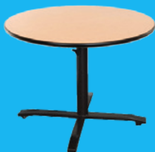
Table ajustable pieds central